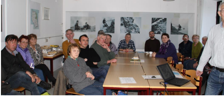
Mynd 3 Fyrsti borgarafundur í skúlanum í Skúvoy var tann 22. apríl 2015.